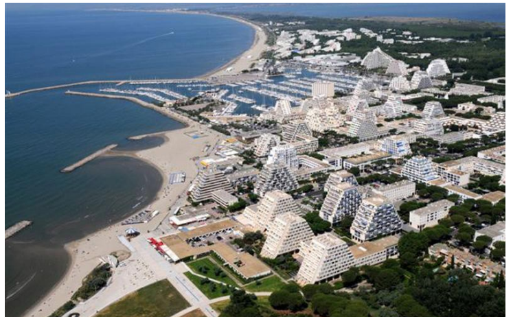
La station balnéaire de la Grande Motte ( vue aérienne )

→ Parmi les cinq types d'espaces touristiques que tu connais, La Grande-Motte appartient auquel ?