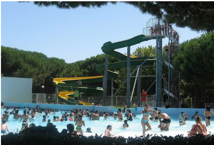
Espace aquatique dans un camping

Pourquoi le tourisme n'est-il pas le même en été qu'en hiver à la Grande-Motte ?