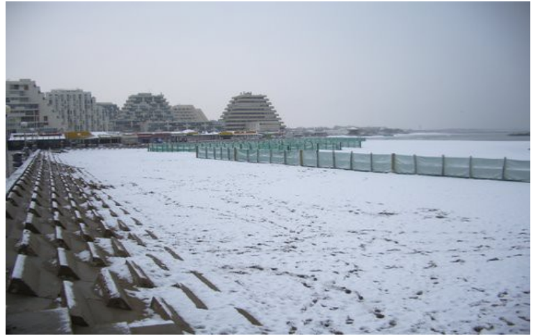
Plage de la Grande Motte ( Languedoc- Roussillon ) : un contraste été / hiver saisissant !

Pourquoi le tourisme n'est-il pas le même en été qu'en hiver à la Grande-Motte ?