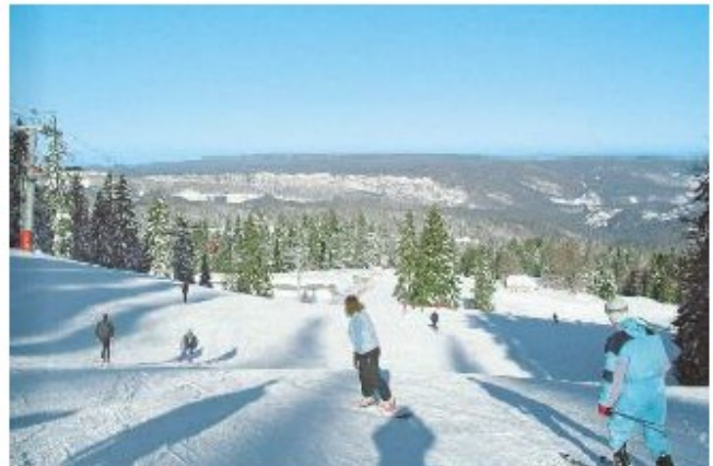
La station des Rousses (Jura)