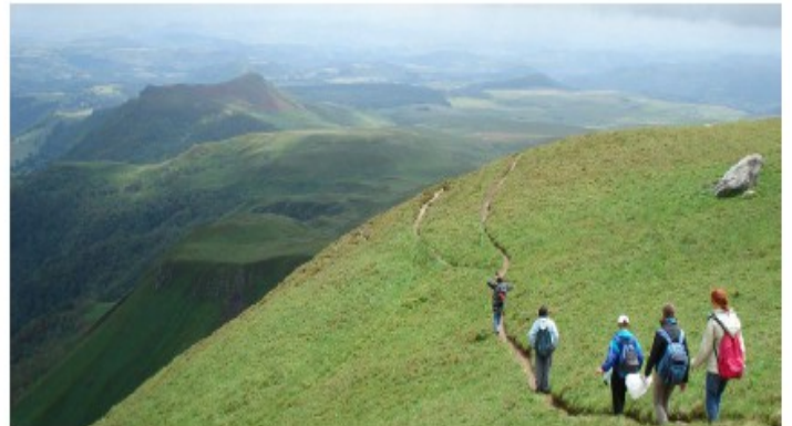
Les volcans d'Auvergne