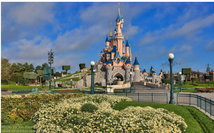
Parc Disneyland ( Seine et Marne )