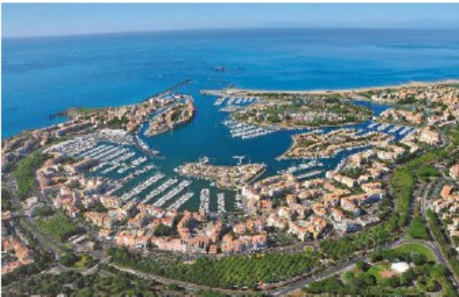
La plage du Cap d'Agde