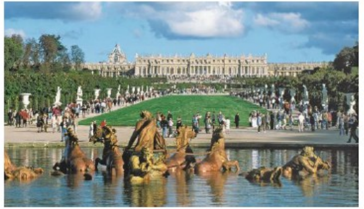
Le château de Versailles