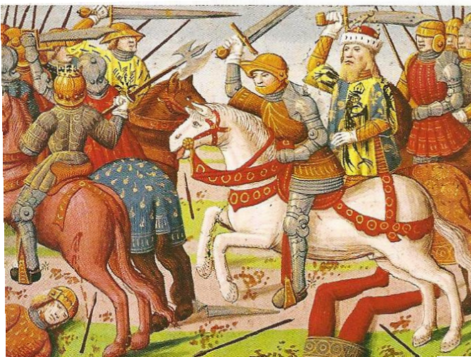
Miniature d'un manuscrit du xv ème siècle