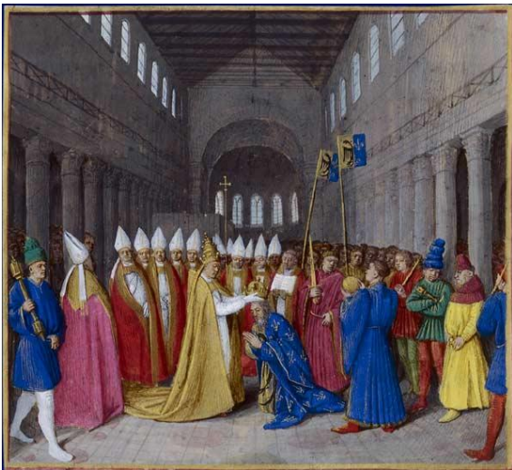
Le sacre de Charlemagne (manuscrit du XV ème siècle)

Charlemagne aide plusieurs fois le pape contre ses ennemis, resserrant ainsi les liens entre l'Eglise et la royauté. En l'an 800, le jour de Noël, il est couronné empereur par le pape à Rome.