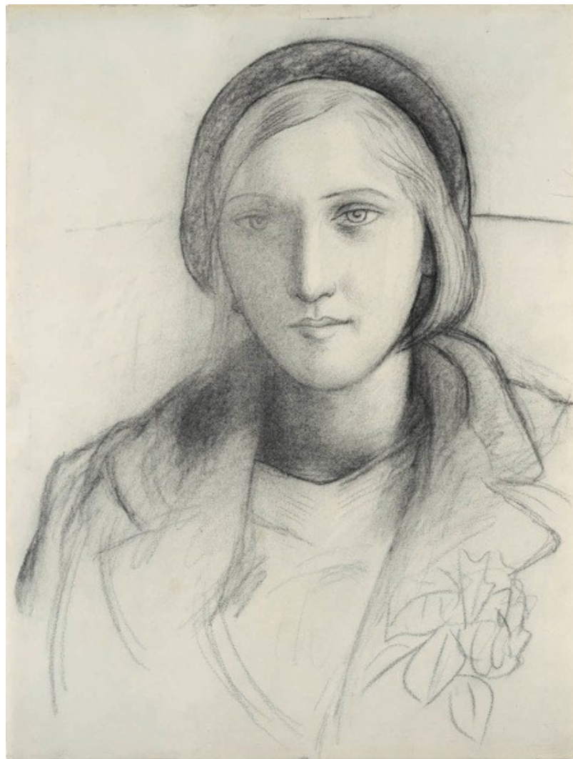
PABLO PICASSO Marie-Thérèse coiffée d'un béret , 1927 Charcoal on paper, 24 7/8 x 18 15/16 inches, (63 x 48 cm) PICAS 1927.0003