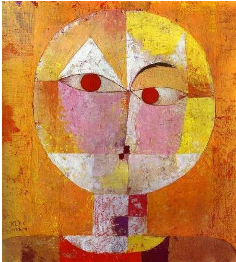
Paul Klee, Head of a man. 1922