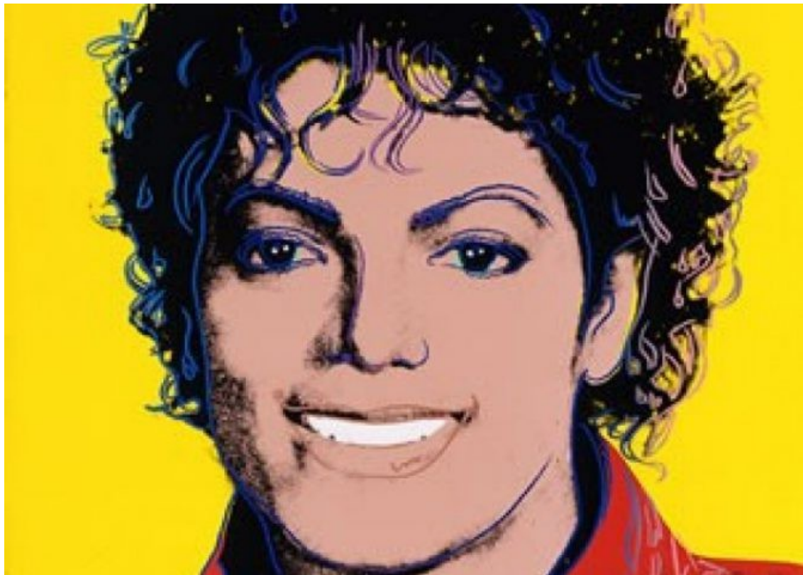
Michael Jackson par Andy Warhol , 1984.