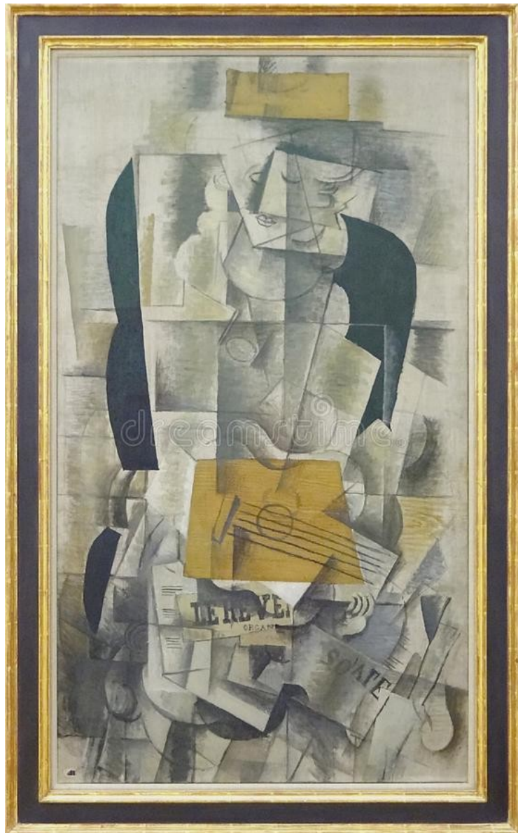
Femme à la guitare, George Braque 1913