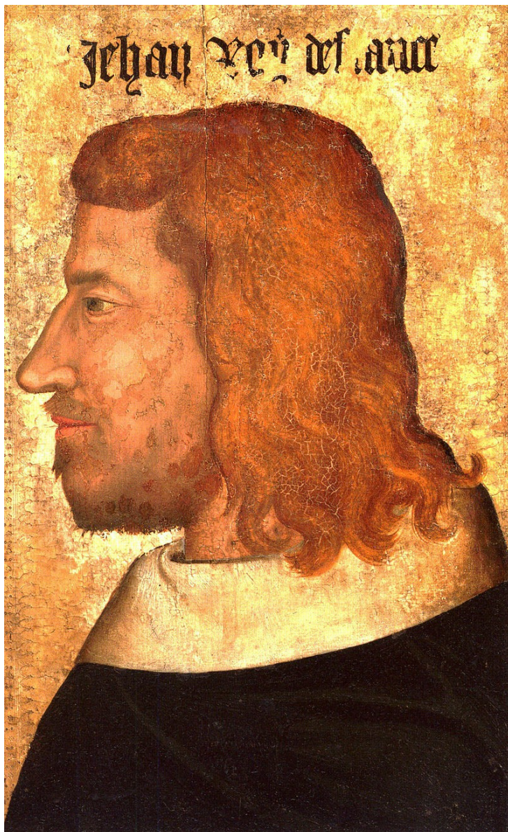
Jean Le Bon vers 1350 (anonyme).