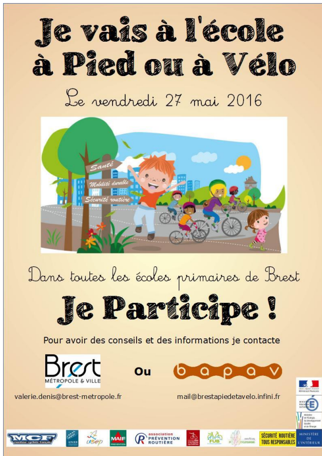
Doc 1 : Les déplacements de chez soi à l'école Affiche d'information.

1- Quelle est la nature de ce document ?