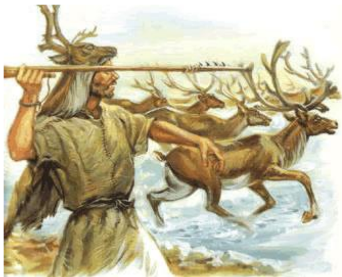
Doc 1. Utilisation d'une sagaie