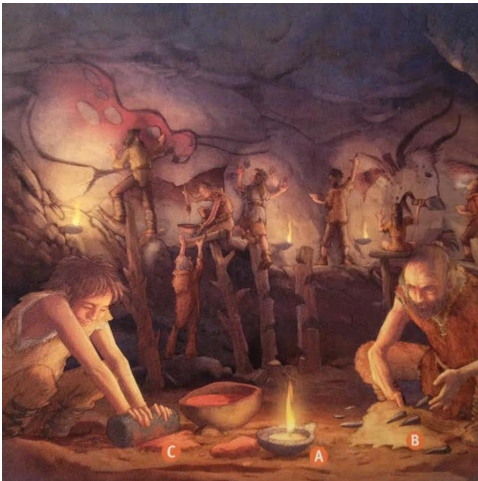
Doc 3. Hommes préhistoriques réalisant des peintures dans une grotte