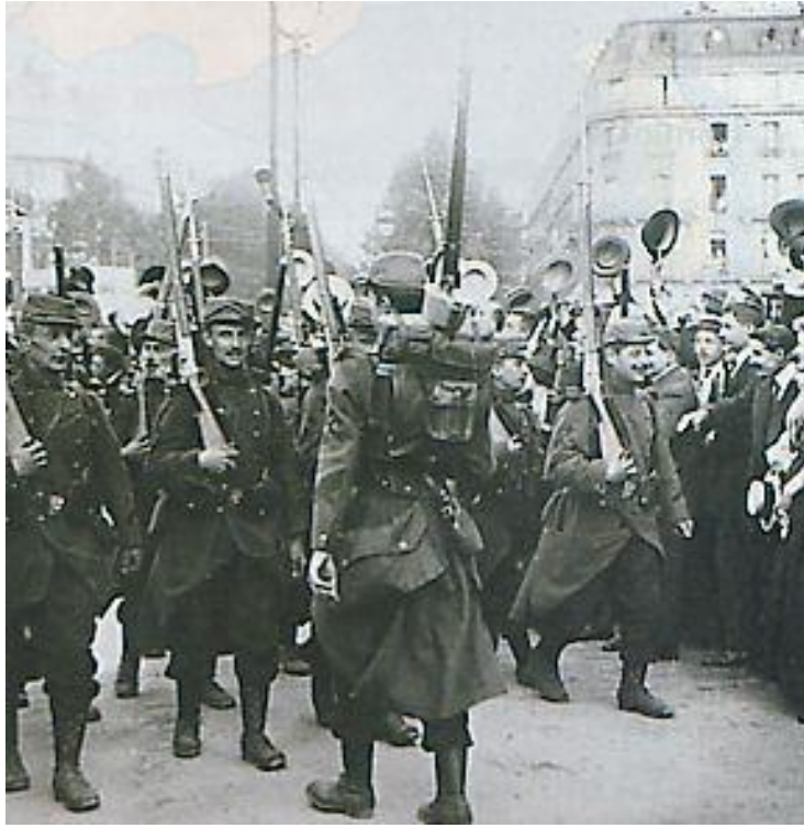
Mobilisation des parisiens Août 1914