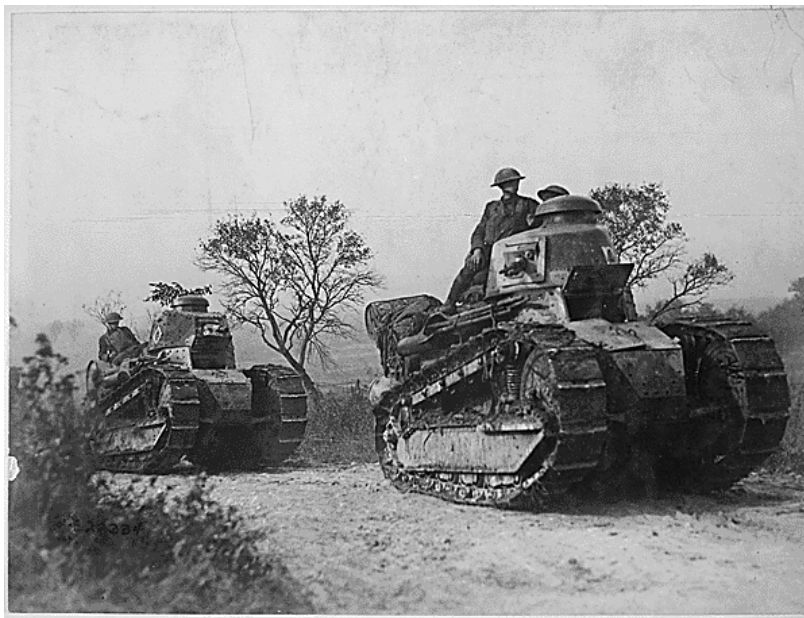
Soldats américains dans des chars d'assaut en 1918