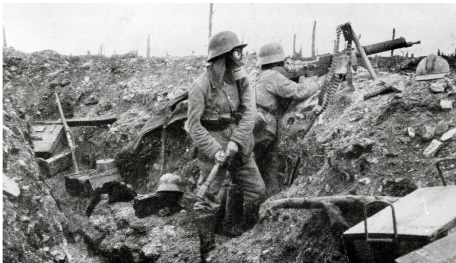
Soldats allemand dans une tranchée 1916