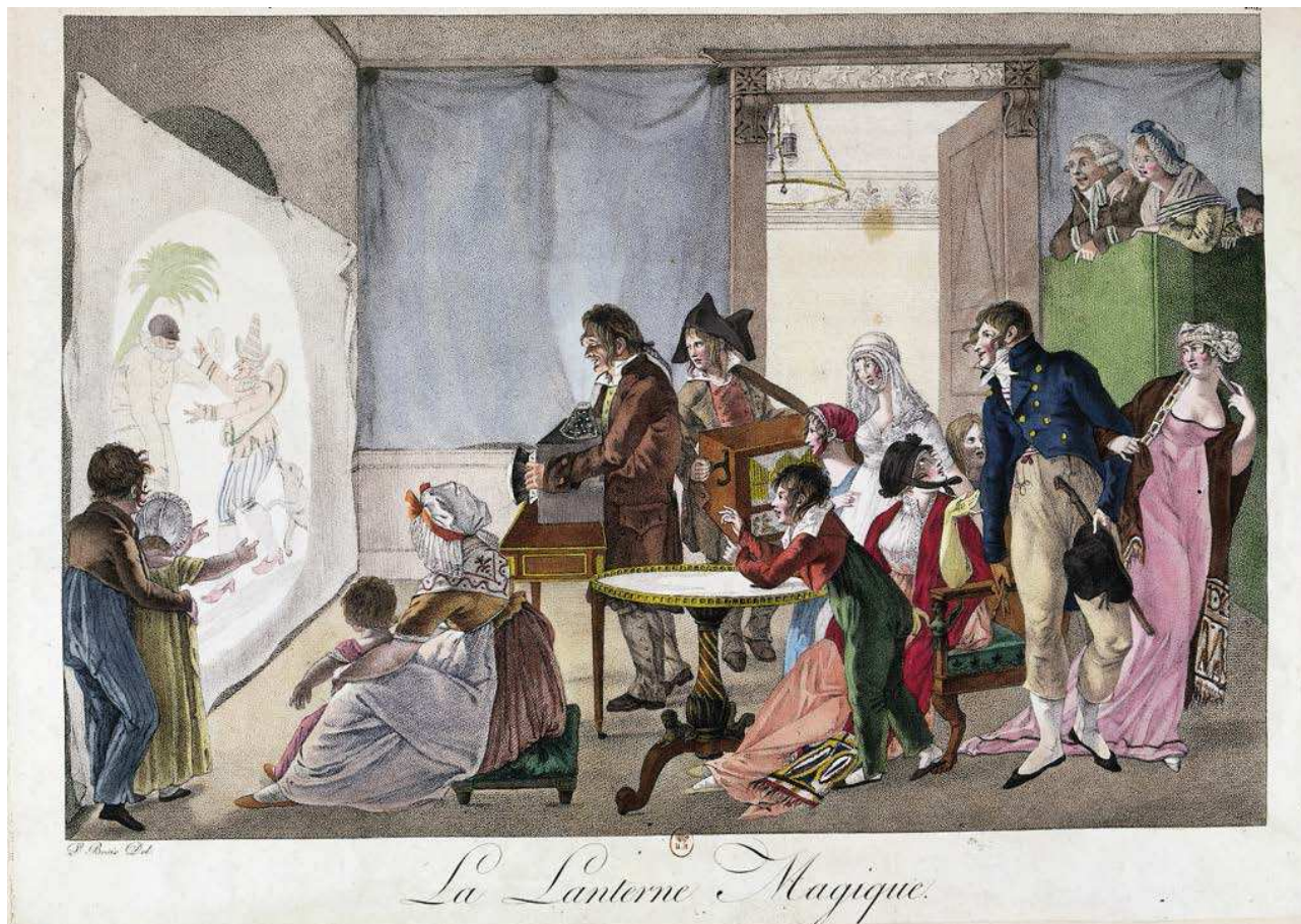
La Lanterne magique, 1798 , de Jean-François Bosio (1764 -1827)

La lanterne magique est l'ancêtre des appareils de projection et particulièrement du projecteur de diapositives.